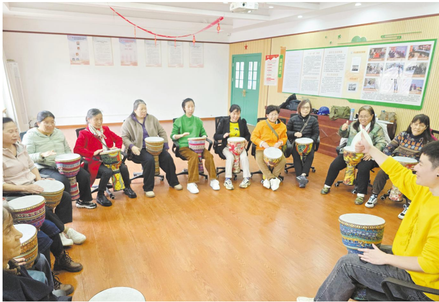
老人正在学习非洲鼓