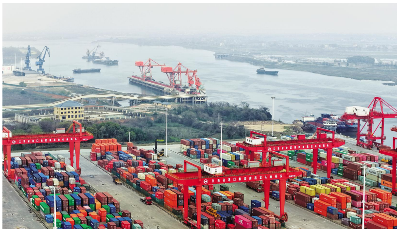
《龙岗货运忙》