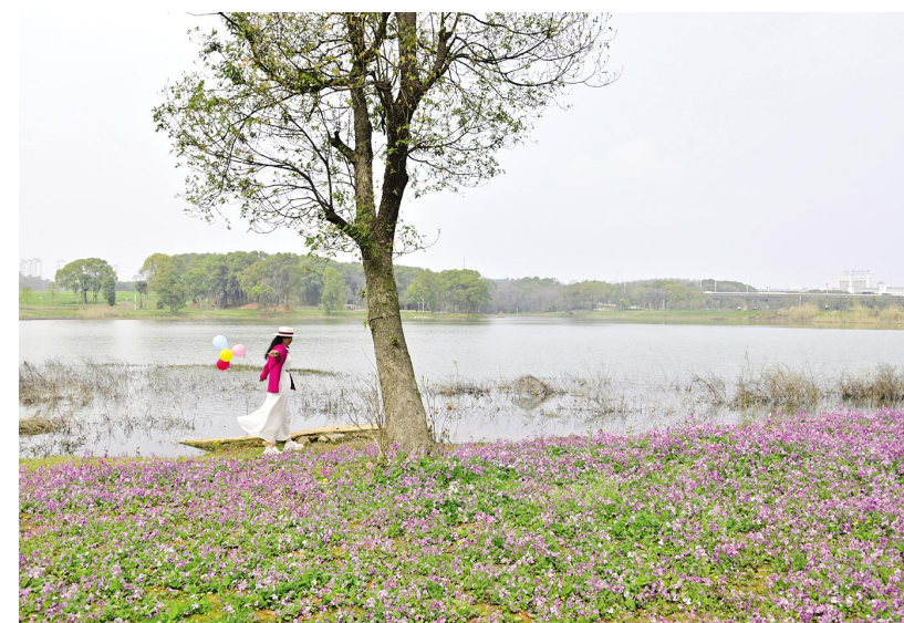
《鱼目山公园里的春天》