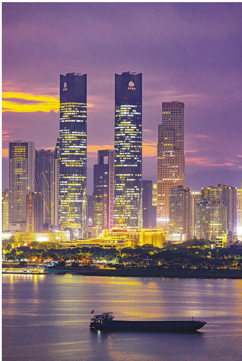
《江映夜繁华》