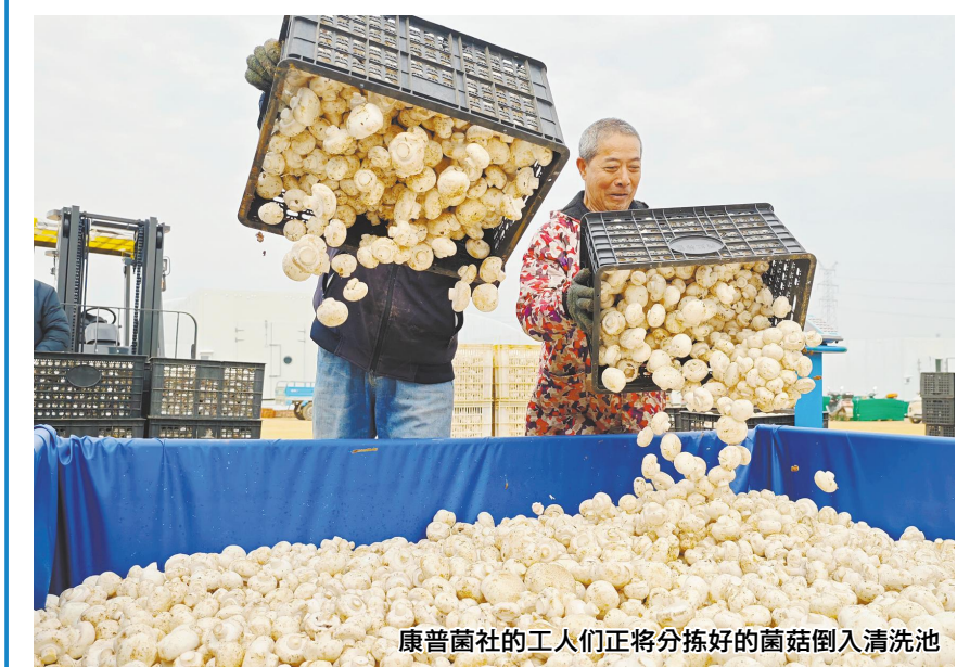
康普菌社的工人们正在分拣好的菌菇倒入清洗池

力催生新质生产力;“产业发展+创业”赛道紧扣我省“1269”行动计划,以优化提升传统产业、培育壮大新兴产业和未来产业为核心目标,推动产业规模化、高端化、绿色化发展;“职业技能+创业”赛道依托我省职业技能优势和特色劳务品牌资源,构建“创业驱动培训、培训提升技能、技能赋能创业”的良性闭环;“民生需求+创业”赛道聚焦衣食住行、医疗健康等民生关切,扩大优质消费品和服务供给,激活消费新潜能;青年创新专项赛则面向高校毕业生为主的青年群体,鼓励青年投身创新创业实践。