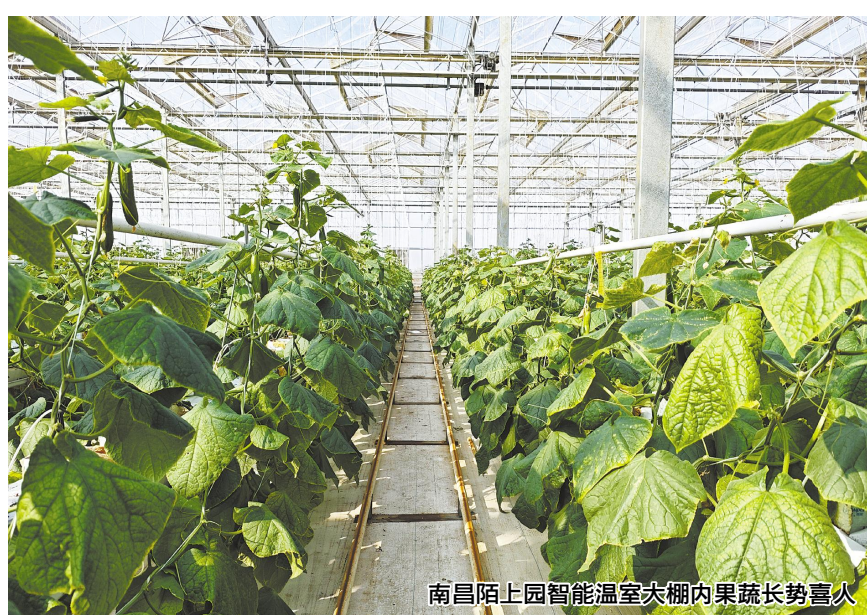
南昌陌上园智能温室大棚内蔬菜长势喜人